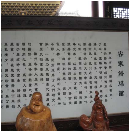
圖三. 客家收藏族譜的地方