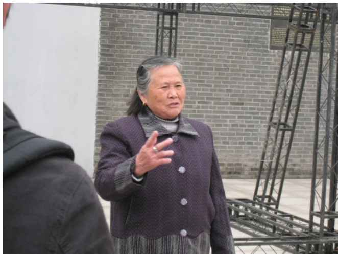
圖八. 唱山歌的客家婦女

「親哥走後守空房，哭哩一場又一場， 叔婆伯姆來相勸，傷心愁激淚兩行。 床頭食飯床尾眠，無人比 更苦情， 出門無個親伯叔，夜裡無個痛腸人。 緊想親哥心緊愁，朝晨起來懶梳頭， 三餐茶飯無滋味，樣般前世束無修。」 (楊熾明, 2003)