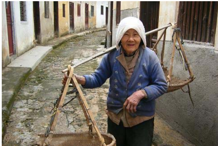
圖五. 客家婦女平日需做大量勞動工作

客家人由於退居山區,經濟落後,而且習慣於不斷遷徙,成年的客家男性大多離開家出外或到南洋謀生創業,一去可能便是幾十年,故家庭、生產等工作都落在婦女身上。她們平日需要處理的事情,包括打理家務事、照顧長輩及小孩、教育子女、到農田收割、接待訪客等等。女性必須具備四項「婦工」才能算是一個被社會接受的好女人及能夠出嫁,所以她們自小便受到這四種的訓練及教育:持家、種田、打柴料理、女紅(圖五)。(黃雄祥,2002)